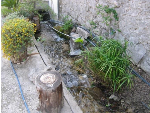
Slika 3. Trsteno – „vodoopskrbna mreža“ u dijelu naselja južno od Jadranske magistrale

vodoopskrbnim objektima, sanitarna inspekcija u više je navrata postavljala obavijest da voda nije za piće, ali stanovništvo na tom području i dalje je koristi za piće (npr. Trsteno).