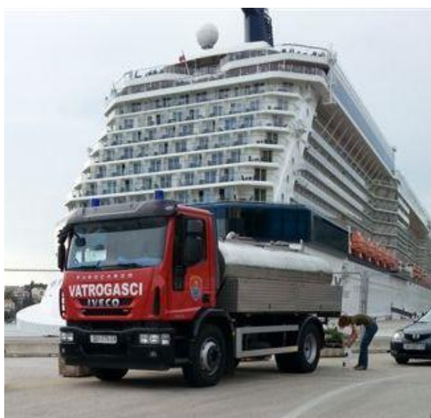
Slika 2. Autocisterna JVP Dubrovački vatrogasci isporučuje vodu za ljudsku potrošnju u Gruškoj luci

Iako ova vrsta vodoopskrbe više nije u programu Ministarstva zdravlja, smatrali smo kako program monitoringa ipak treba obuhvatiti i ovakve uzorke. Primjerice, u rujnu 2014. godine u gradu Dubrovniku javna vodoopskrba organizirala se autocisternama zbog velikog zamućenja. Kako nismo imali detaljne naputke Ministarstva zdravlja o postupanju u ovakvim situacijama, Zavod je u suradnji s isporučiteljem vodne usluge Vodovodom Dubrovnik d.o.o. uzorkovao vodu i iz autocisterni. Uzorkovali smo uzorke iz dvije autocisterne s područja grada Dubrovnika. Oba uzorka nisu odgovarala zakonskim propisima (izolirani ukupni koliformi, povećana koncentracija slobodnog klora). Svakako treba naglasiti da ti uzorci nisu bili ispravni, ali da voda nije bila opasna za zdravlje.